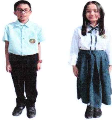
المدرسة الإعدادية (الصف ٧ إلى الصف ١٠)