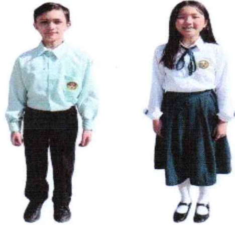
المدرسة الثانوية العليا (الصف ١١ إلى الصف ١٢)